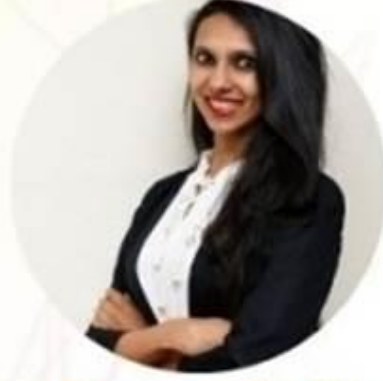
Preeyam Budhia India Water conservation