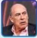
Muhtar KENT The Coca-Cola Company Emekli Yönetim Kurulu Başkanı ve CEO'su